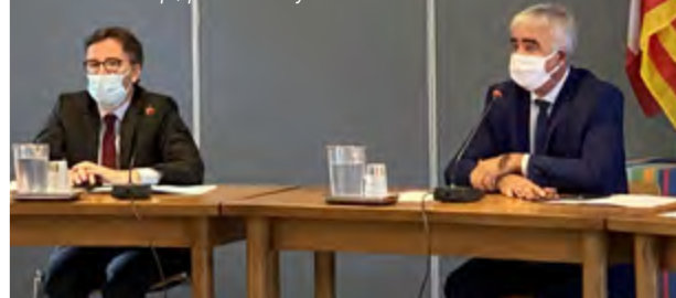
Etienne Stoskopf, préfet des Pyrénées-Orientales

en réunissant tous les acteurs mobilisés pour la préservation de la sécurité, de la tranquillité mais aussi, au final, de la qualité de vie et de l'image de notre ville. Dans le cadre des compétences communales, après le renforcement des liens entre la police municipale et la gendarmerie, selon un tandem efficace, l'extension du réseau de vidéo-protection (effort d'équipement souligné par les services de l'État) au secteur plage fait partie des solutions applicables.