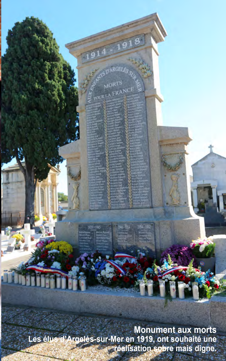
Monument aux morts Les élus d'Argelès-sur-Mer en 1919, ont souhaité une réalisation sobre mais digne.

Puis des gerbes ont été déposées au pied du "soldat de pierre" en hommage aux hommes et aux femmes qui, depuis 1914, se sont battus pour notre pays et pour la paix. Un hommage particulier a été rendu aux trois militaires morts pour la France, en opération extérieure, cette année.