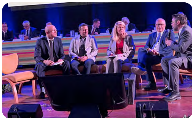
Table ronde autour de Mme Dominique Faure, Ministre des Collectivités Territoriales et de la Ruralité.

Les discussions ont permis de renforcer les liens intercommunaux et de partager des solutions novatrices face aux défis actuels.